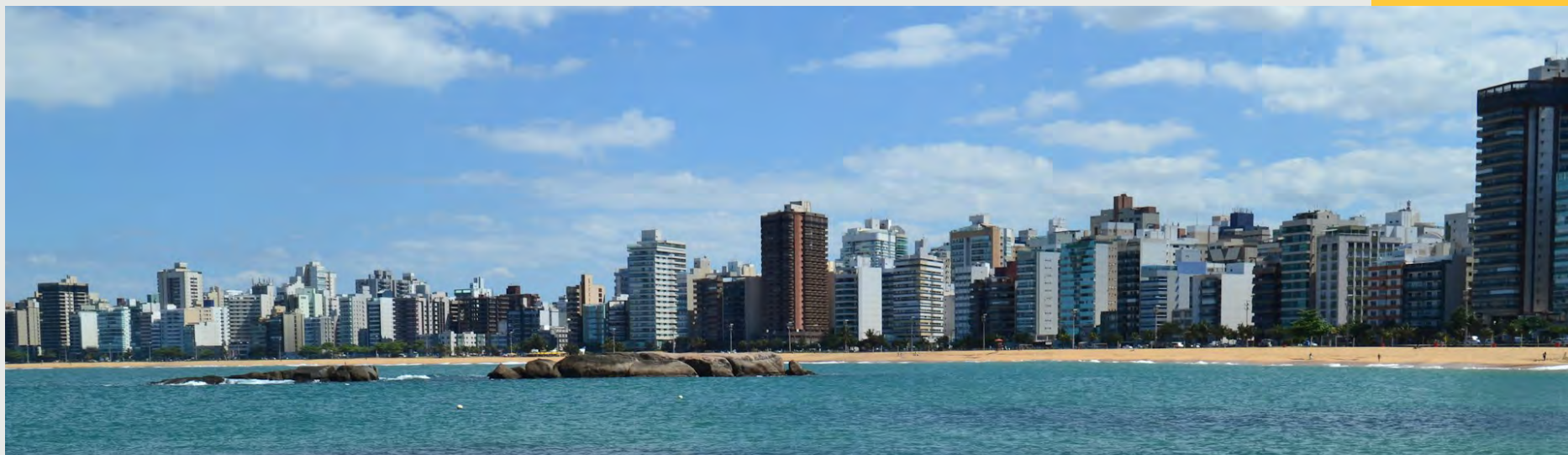
Praia da Costa