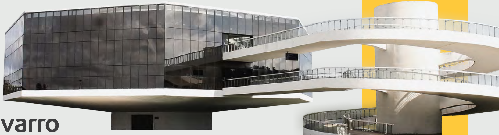
Estação Cabo Branco

Formação de bancos de areia no mar, que aparece na maré baixa, local bastante procurado para fotos e banho em águas cristalinas.