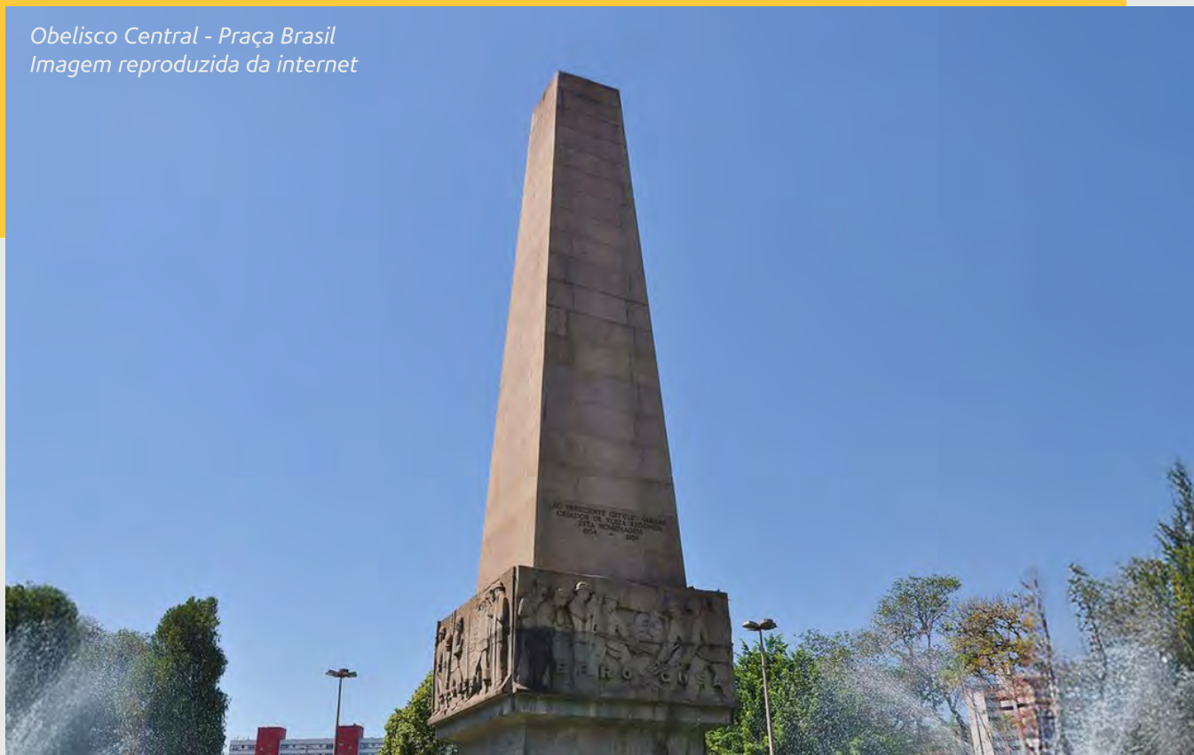
Obelisco Central - Praça Brasil Imagem reproduzida da internet