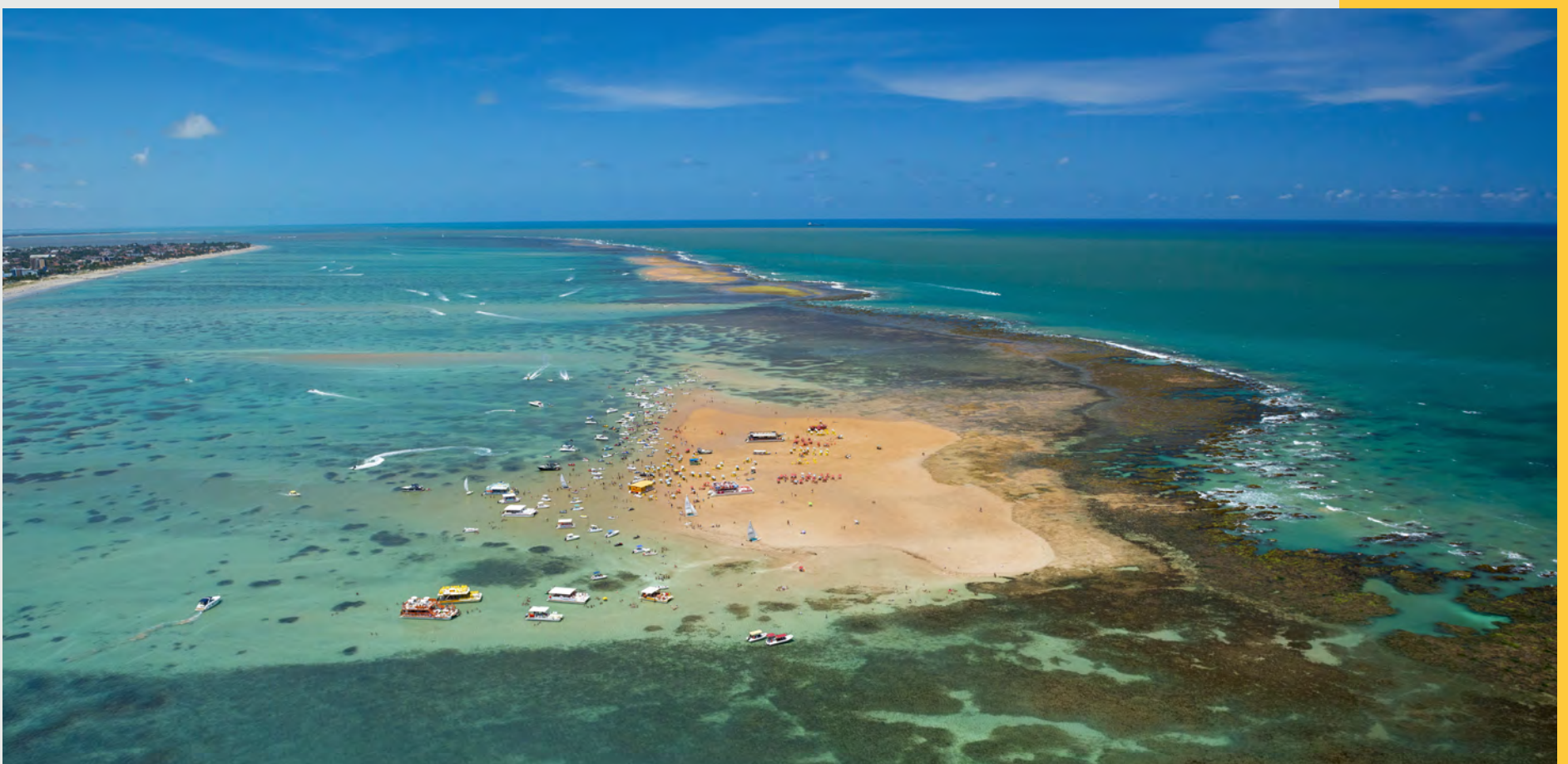
Ilha da Areia Vermelha