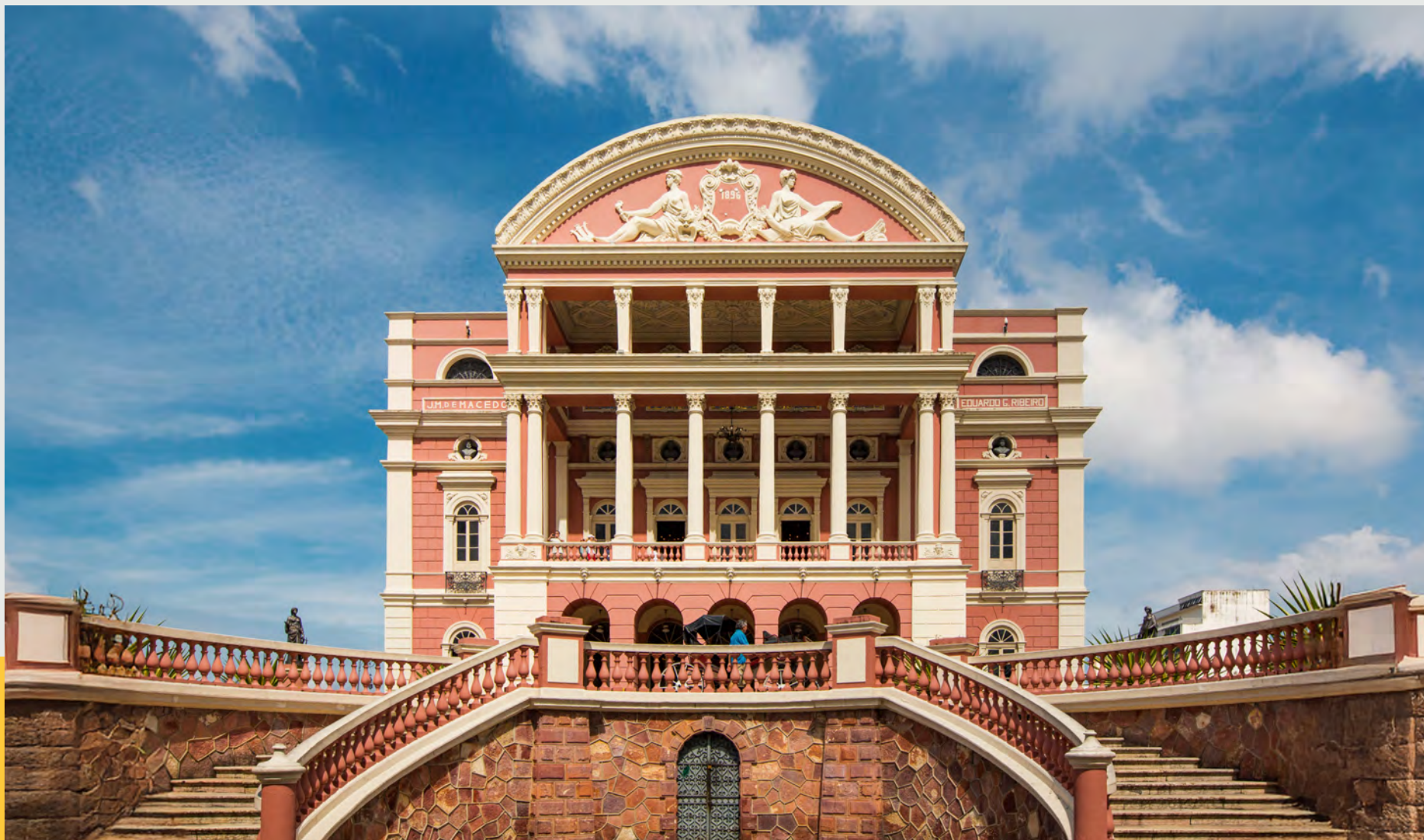
Teatro Amazonas | Imagem reproduzida da internet