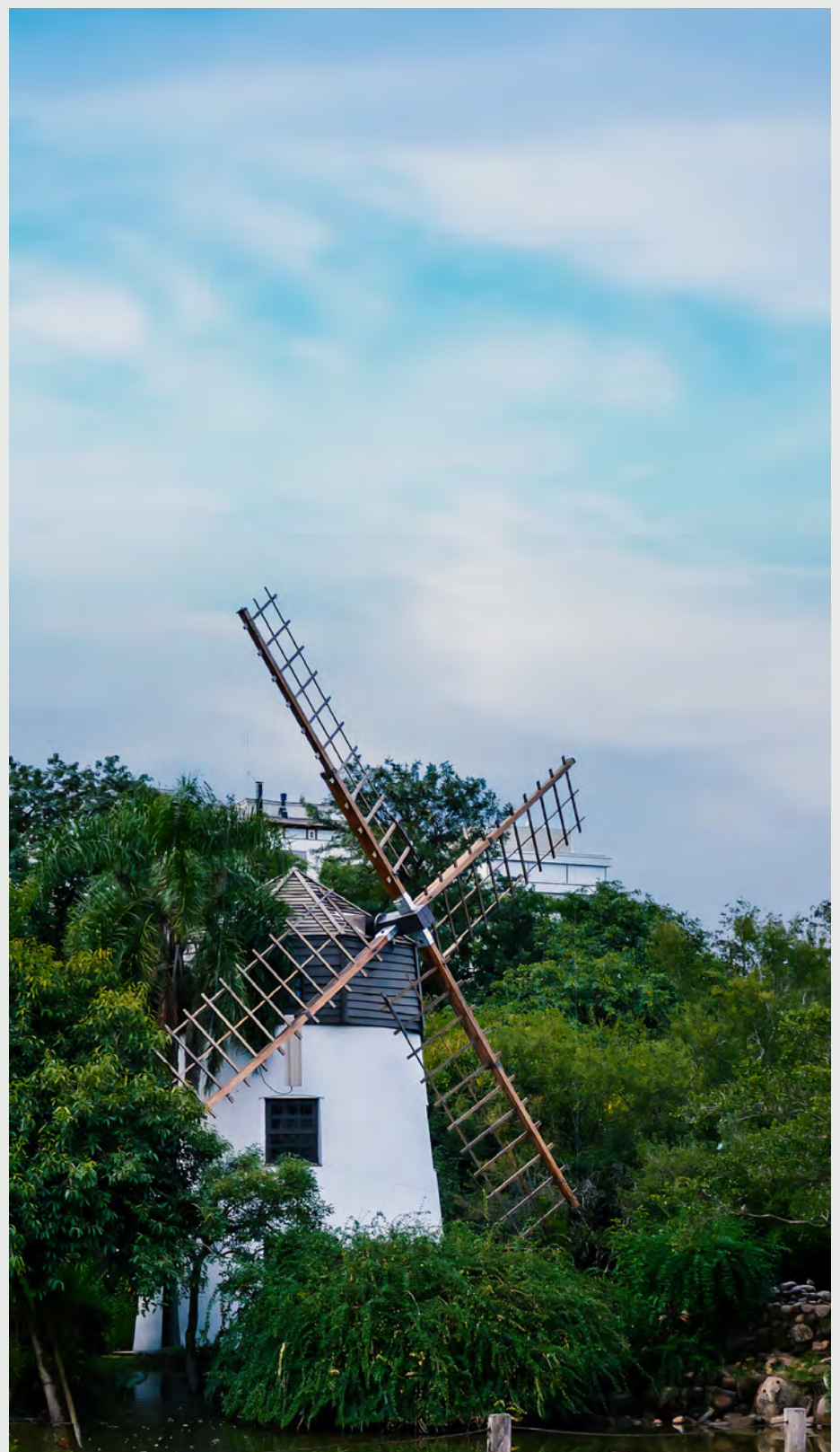
Moinho Açoriano - Parque Moinhos de Vento

Um dos parques mais agradáveis e familiares de Porto Alegre, com áreas verdes amplas, lago, pista de caminhada e espaços para convivência e atividades ao ar livre.