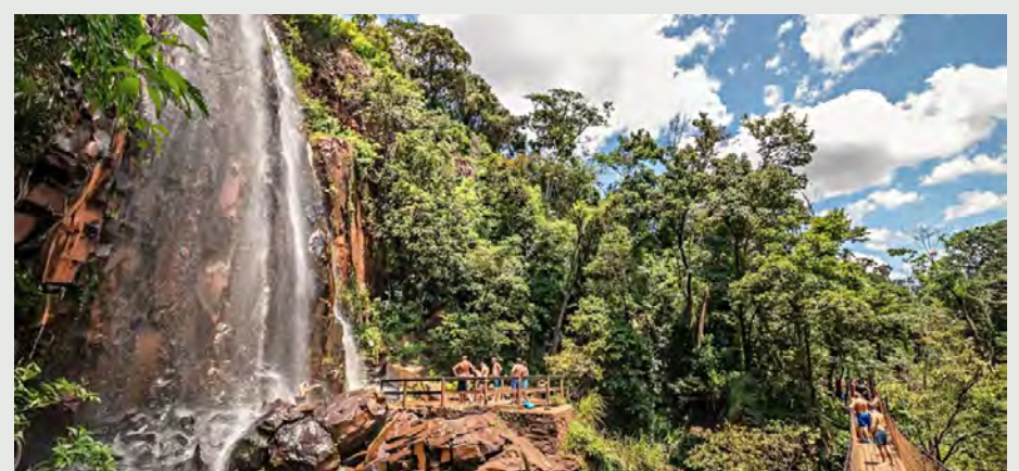
Recanto das Cachoeiras e Estádio Raulino de Oliveira Imagens reproduzidas da internet

Um dos mais tradicionais espaços culturais da cidade, com apresentações teatrais, musicais e eventos artísticos ao longo do ano.