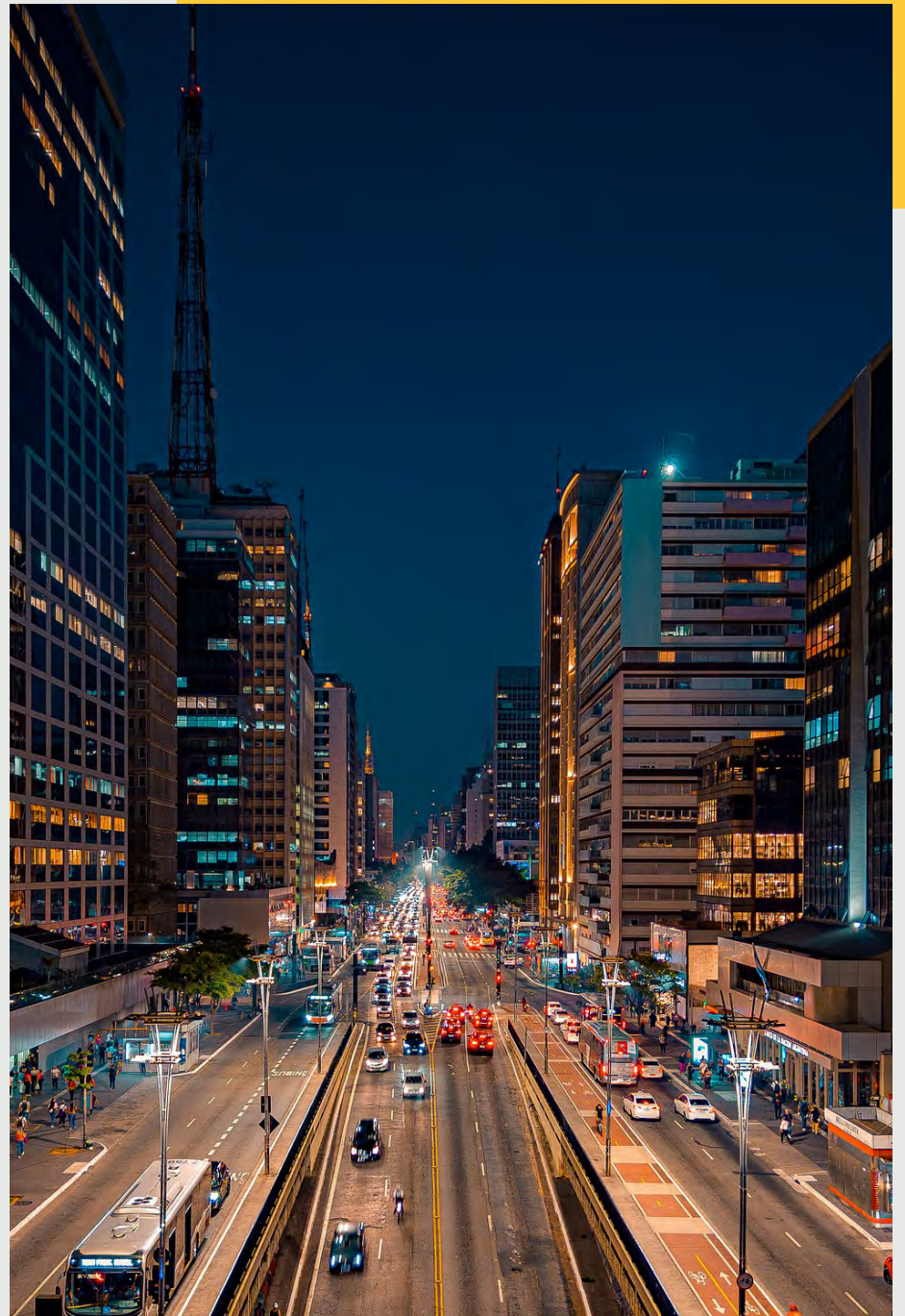
Avenida Paulista Imagem reproduzida da Internet

Instalado na Estação da Luz, celebra o idioma português de forma interativa, sensorial e moderna. Um dos museus mais inovadores do Brasil.