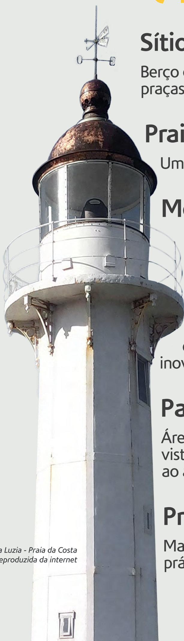
Farol Santa Luzia - Praia da Costa

Mais extensa e ventilada, excelente para caminhadas, prática de esportes e convivência familiar.