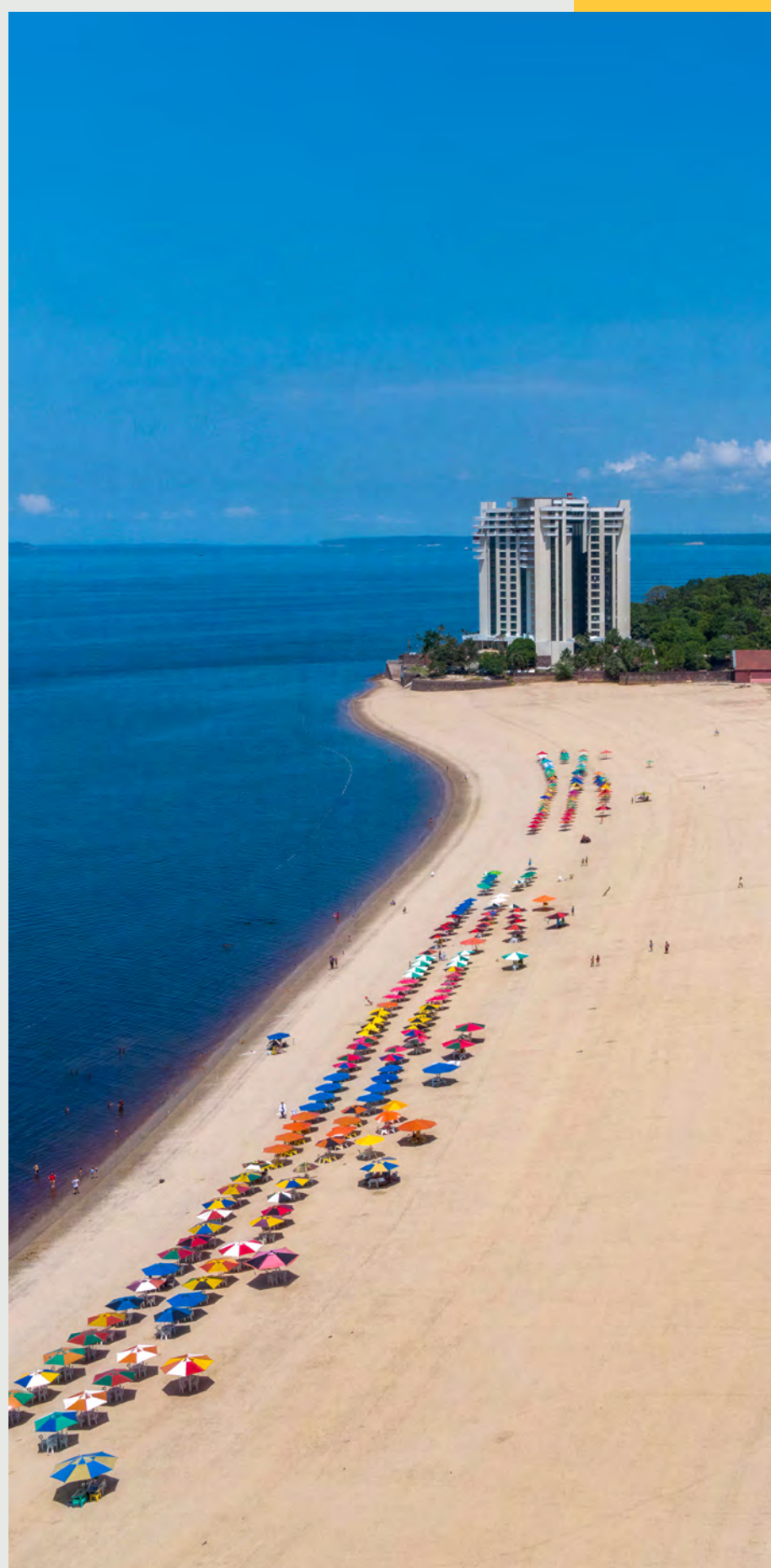
Praia de Ponta Negra

Experiência imersiva no ciclo da borracha. Casas, objetos e histórias da época, acesso feito de barco.