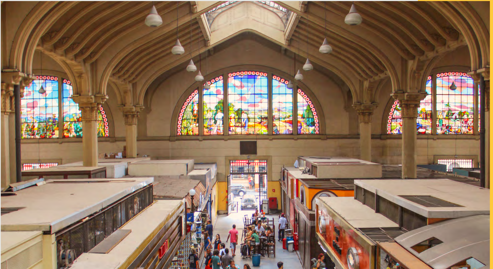
Mercado Municipal