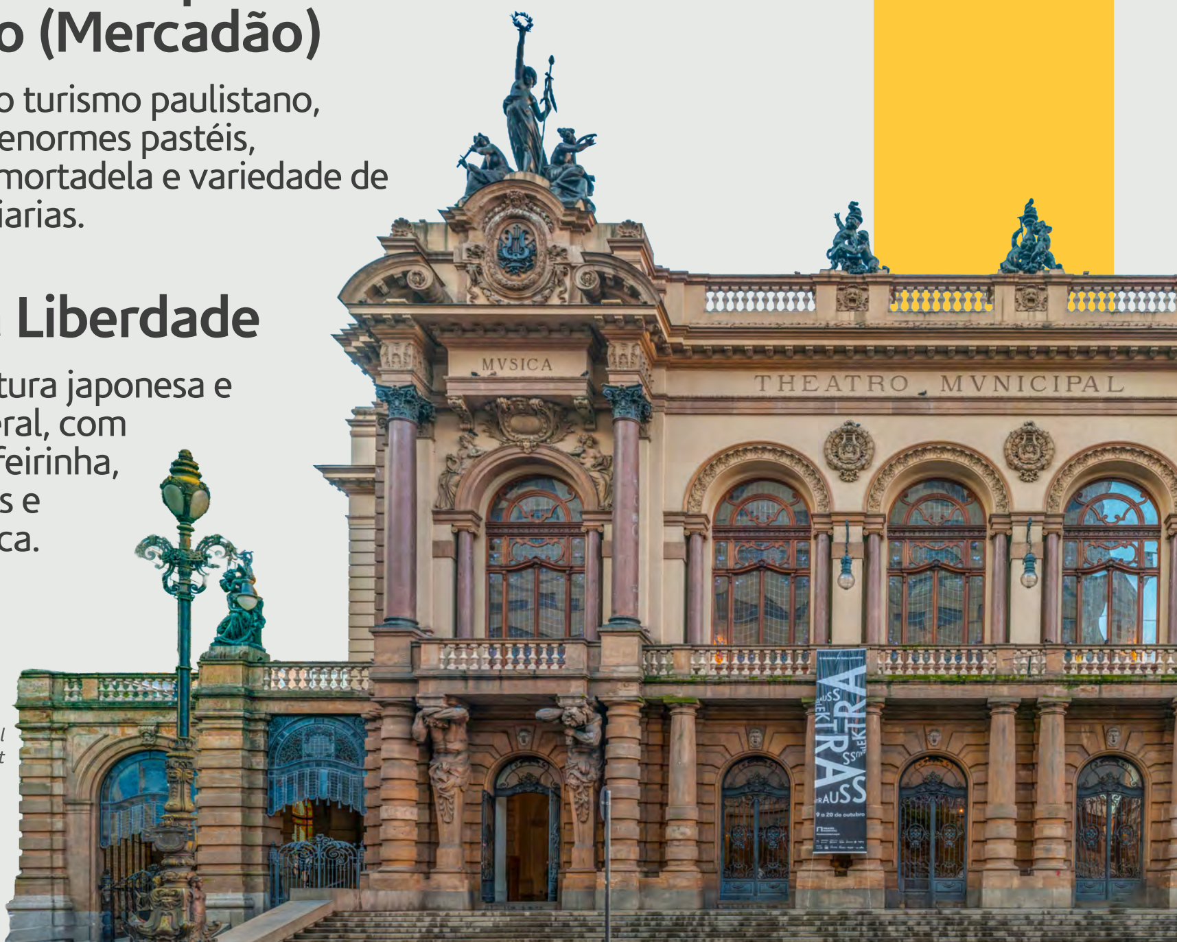
Theatro Municipal

Reduto da cultura japonesa e asiática em geral, com gastronomia, feirinha, lojas temáticas e atmosfera única.