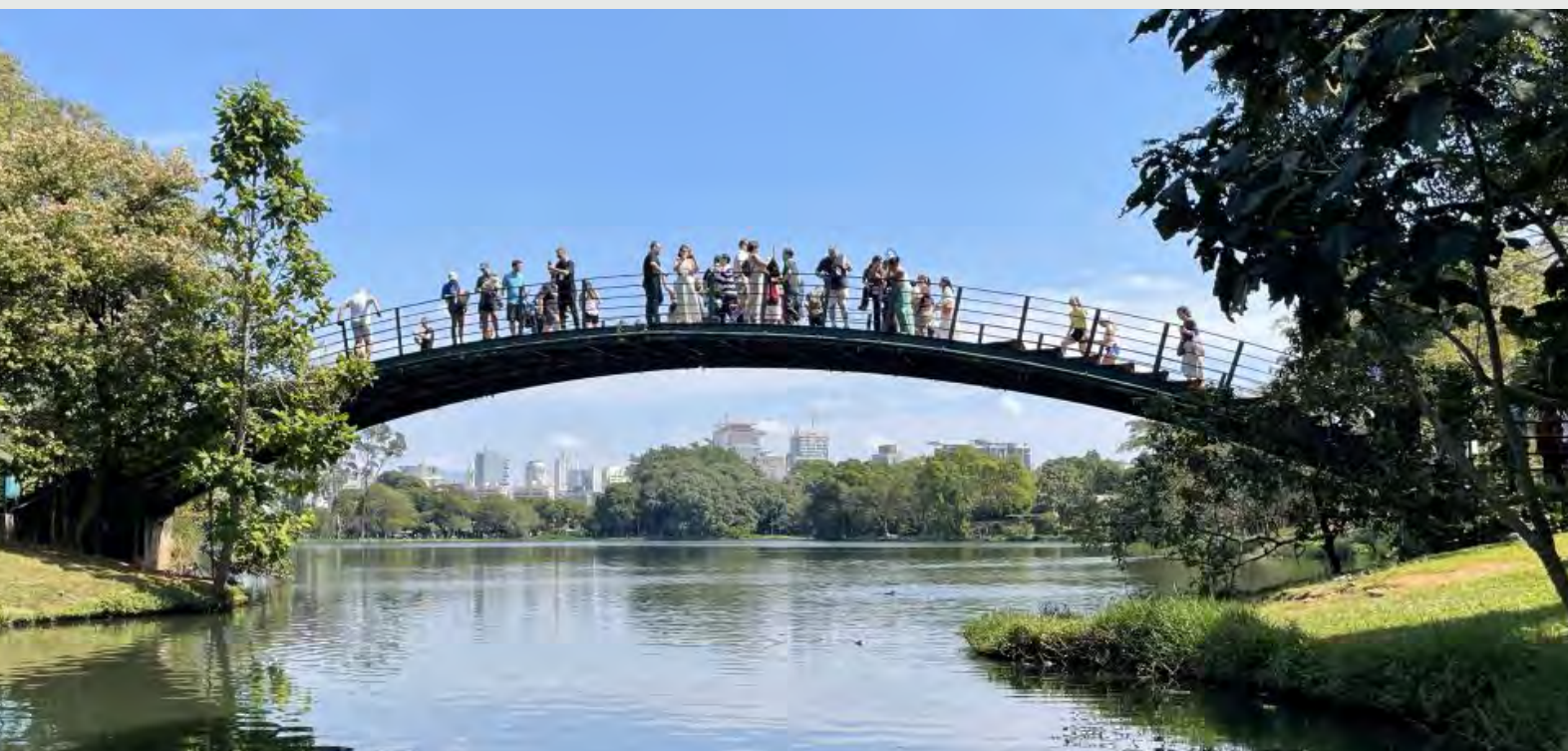
Parque Ibirapuera

Arquitetura impressionante e importância histórica para a cultura brasileira. Visitas guiadas são muito procuradas.