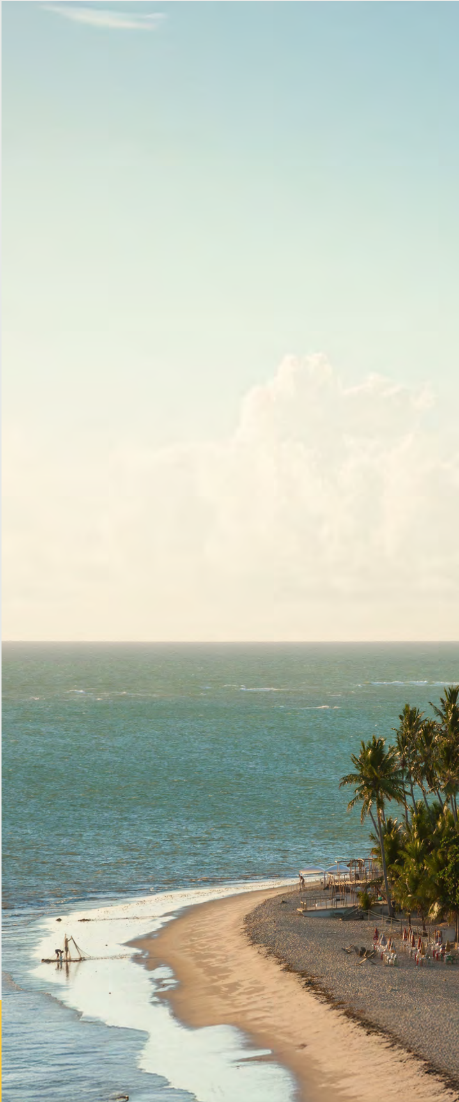
Ponta do Seixas