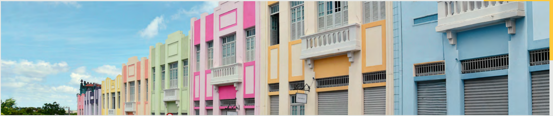
Centro Histórico